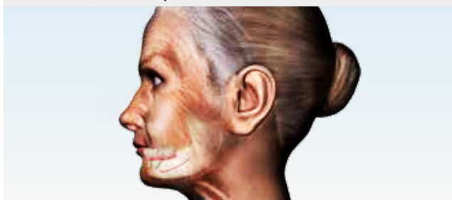
Fig. 2: Les tissus osseux des maxillaires sont préservés grâce à la restauration implantaire.

De belles dents bien positionnées ne facilitent pas seulement le sourire mais vous offrent aussi de la sécurité. Elles sont le symbole de la santé, de la vitalité et de la joie de vivre.